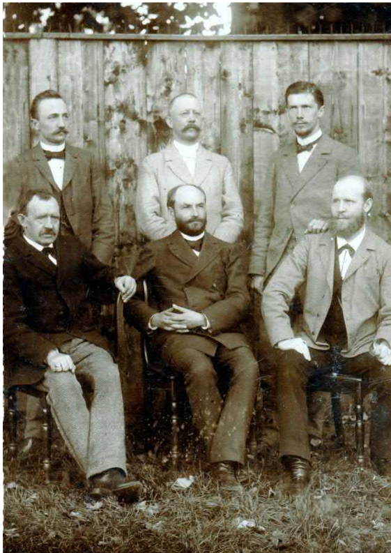
Das erste Kollegiumsbild überhaupt stammt aus dem Jahr 1896:

Mitte der 1890er Jahre beginnt nicht nur in Deutschland, sondern weltweit eine neue Phase wirtschaftlichen Aufschwungs, an der dieses Mal auch Varel seinen Anteil hat. Es wäre eine eigene Untersuchung wert, welche Standortfaktoren Varel begünstigen