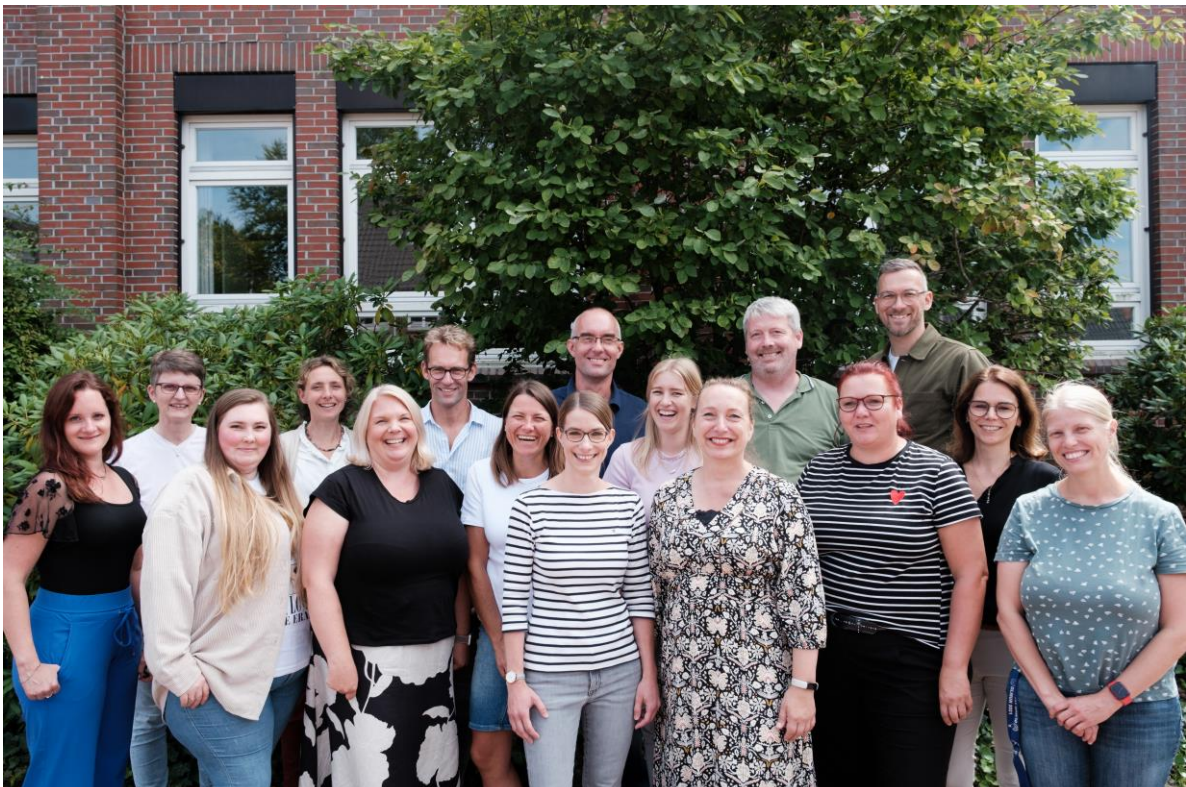
Fachgruppe Englisch am LMG 2024.

Das Lothar-Meyer-Gymnasium bildet regelmäßig Referendare im Fach Englisch aus und zweimal im Jahr kommen Praktikanten von den Universitäten zu uns an die Schule. Dadurch sind wir in der Fachgruppe immer wieder gefordert, unseren eigenen Unterricht zu reflektieren und zu verbessern.