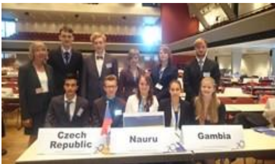
Oldenburg Model United Nations für die Jahrgänge 10 – 12