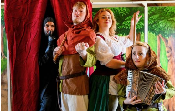
Engelssprachige Theatervorstellungen für die Jahrgänge 5 und 6