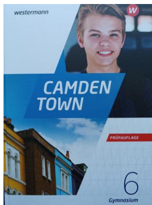
Jahrgänge 5-10 Camden Town

Im Schuljahr 2025/2026 arbeiten wir mit folgenden Lehrwerken: