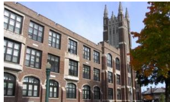
Austausch für die Jahrgänge 9 & 10