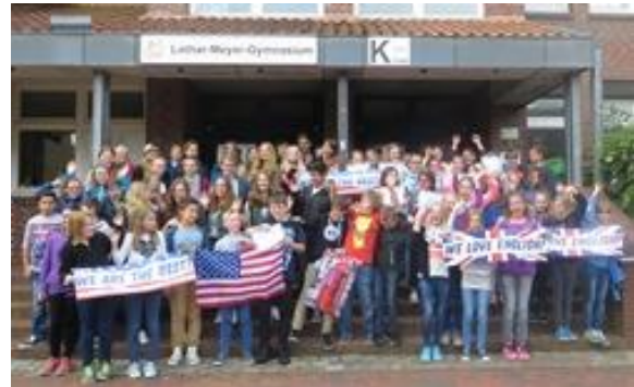
Englischer Wettbewerb für die Jahrgänge 5 -9